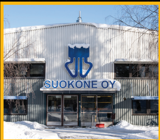
HQ of Suokone Oy in Vuokatti Finland 2021. Suokone Oy:n pääkonttori Vuokatissa 2021.

or you can find your closest dealer from the link below: www.mericrusher.com/en/contact